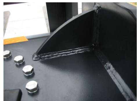
Reinforcements on the inside