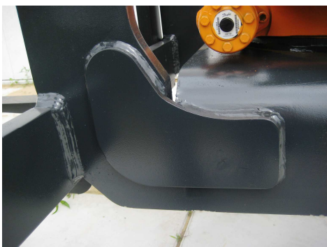
Reinforcements on the outside